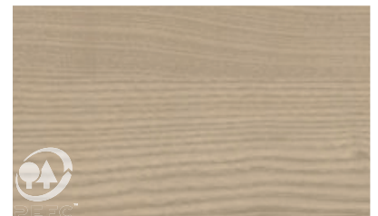
KDI behandelt – Abbildung ähnlich